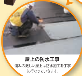
屋上の防水工事 傷みの激しい屋上は防水施工を丁寧に行なっていきます。