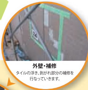
外壁・補修 タイルの浮き、剥がれ部分の補修を行なっていきます。