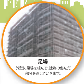
足場 外壁に足場を組んで、建物の傷んだ部分を直していきます。