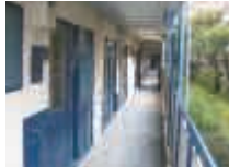
▲通路 今ではアンティークな雰囲気がおしゃれな通路。当時は豪華でモダンな作りだったのでしょね。