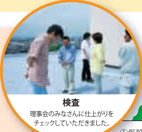
検査 理事会のみなさんに仕上がりをチェックしていただきました。